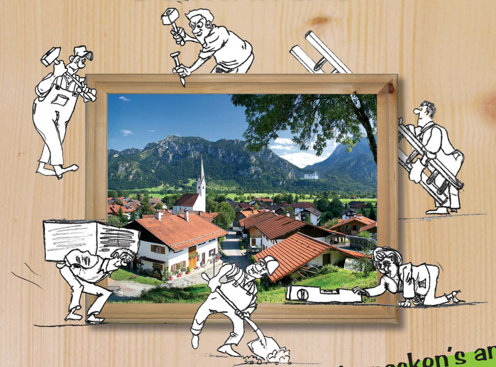
– An alle Haushalte –